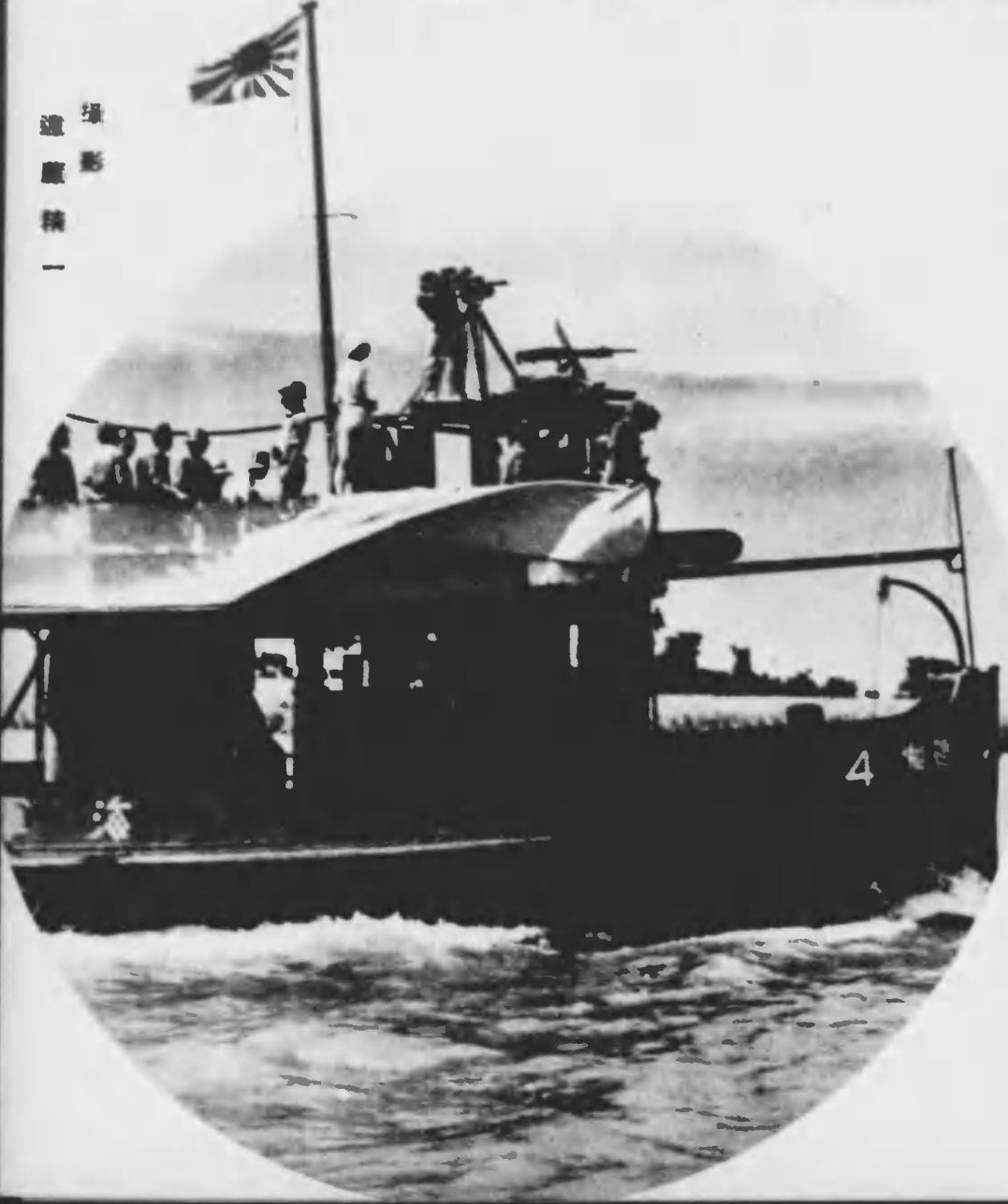
海軍 艦影 一