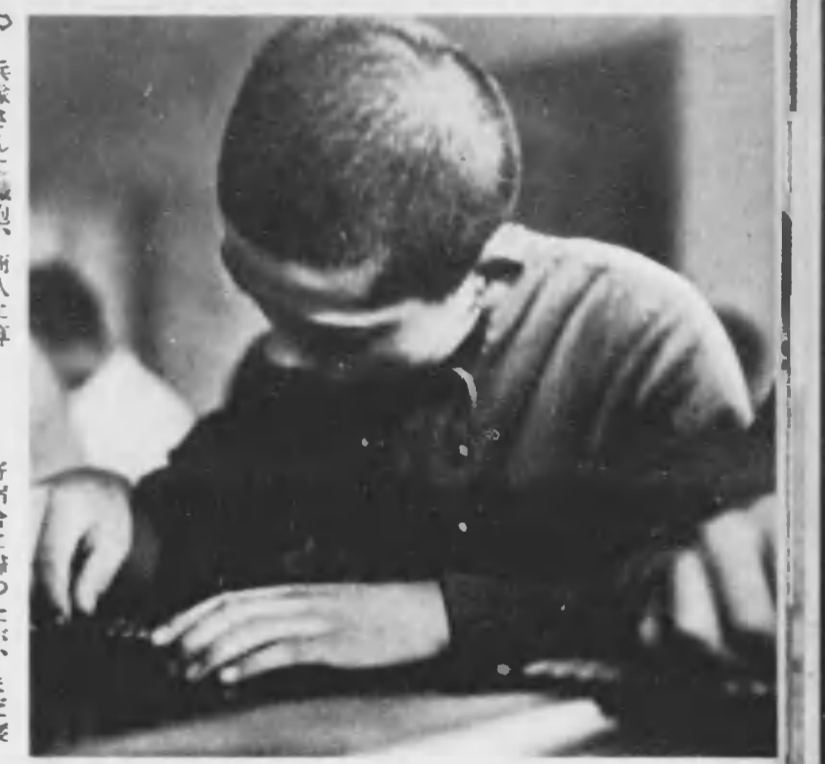
兵隊さんに鑑勉、商人に算盤。そろばんはみつちり勘まねばならない。商店法施行でゆづり早業した頭はあんまり間違つた答も出さず、成績がよかつた。御主人が皆の爲を考へてせつかく建てて下さつた店員學校だ。これから一生懸命やらう。