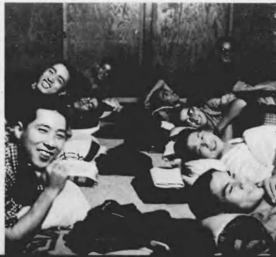
今晚は、映畫會だ。この間の休み、ビクニツクに出かけた時、御主人が、さかんに撮影されてゐたのがけふ出来たのだといふ。これから色キフィルムを買つて一週間に一編位は映畫會をやつて下さるそうだ。又楽しみが一つふへた。