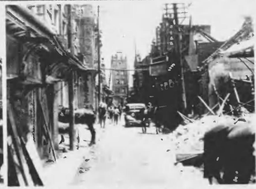
十月五年三十和昭 は戦團包大州徐 たし滅殲を軍人の萬十六師師十八 州徐 るめ休をれ破しはし も馬愛も士勇 に1路るた涼荒 後の戦激 了終日九