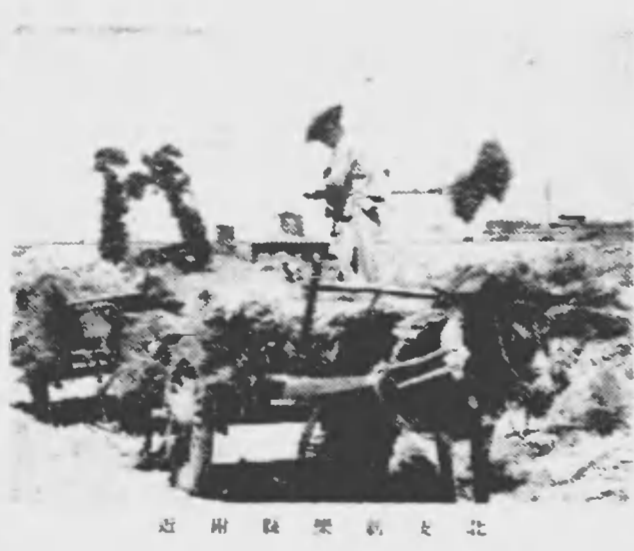
北支 新東亜 建設 現場

歐洲の問題は東亞の問題でもある。歐米は何時、東亞に飛火するかも知れない。わが國は、今、大方針とはいへ、ふりかゝる火の粉まじりにはなほといふのは勿論ない。東亞の一端に火