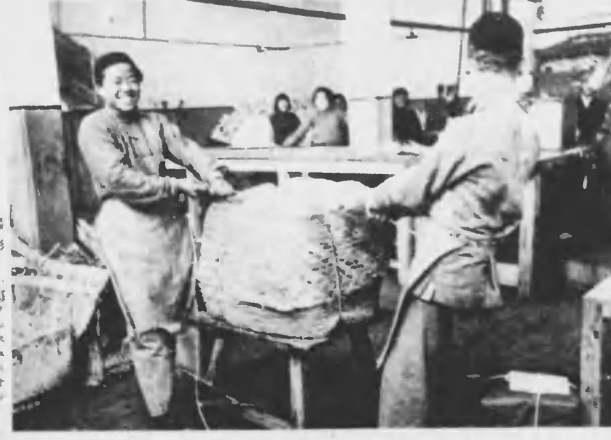
輸出される生絲は湿氣や埃りを防ぐため袋重に包装される。