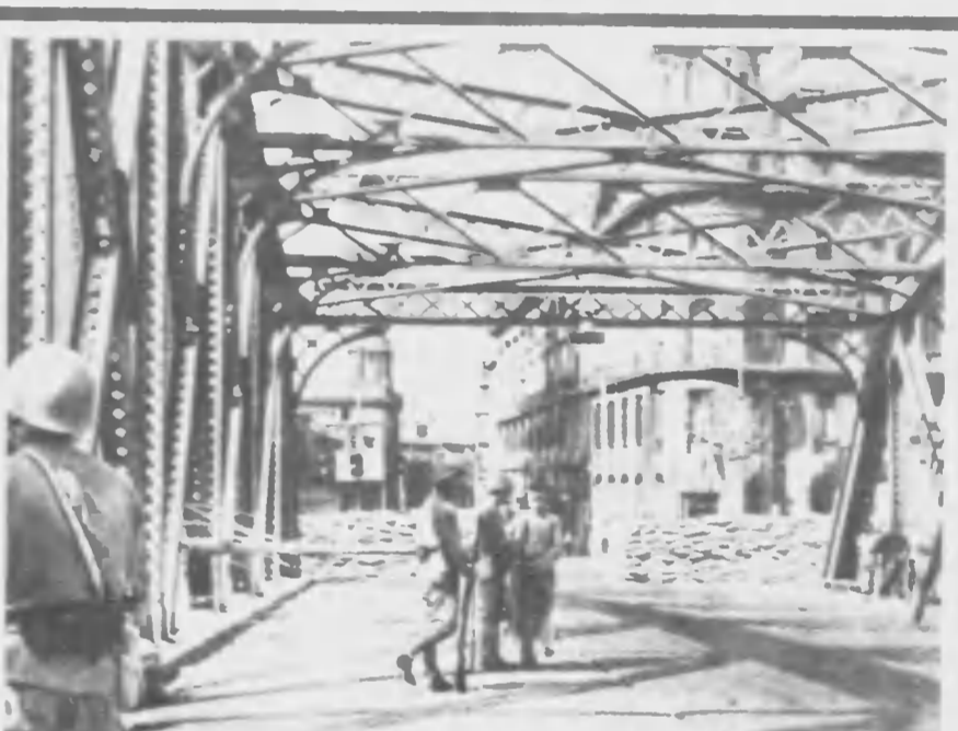
三第て通を橋のこは子身日抗たあての喧里、ドイリ日紅 チッリブンデーカ たれた断を網のこに生現現た飯家(理)ア かのあとし絡連と國