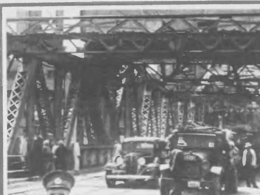
萬 くの景一色鮮明の津天。たれさ除解が絶障の界租佛英津天日十二月六のこ るれか開かび喜の展發をから高はに並足の★人るき過を橋鐵