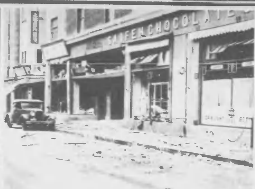
観者らかあれさま揃に襲夜の夜連 きた 背るた鉄道てし是改は敵 路川四北 るあて付境 一のの原石た崩 害あれはこは境市の隊戦時かた たし