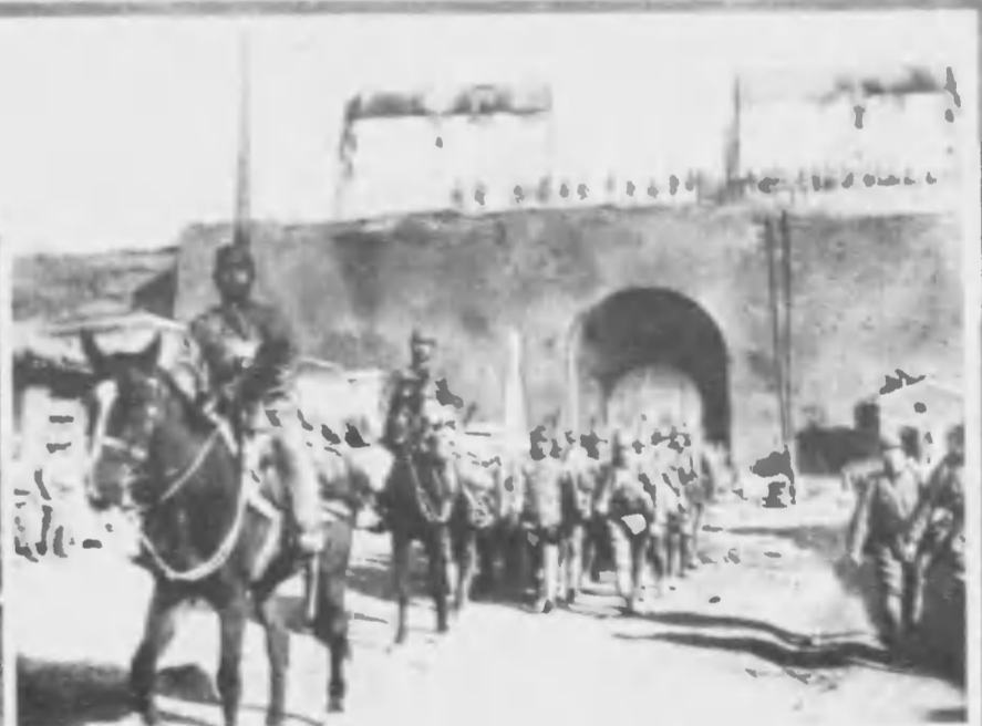
今てつよに手の軍皇たし遠隔らか面方支北は即太たつて都首の名西山 原本 たれさ據占に日九月一十の前年三らか