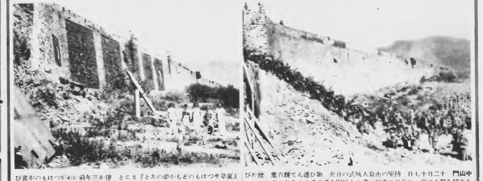
商本日てつじ慣に品商州支べ並を軒か店商州支は路華中り通き抜目の京南し異狼いなも聞ぐつ息に轟掃敵機しへ艦を旗草日く高壁城門華中 路華中たしかけ逃に後を街の廢荒てつ放を火に家民しに恣を掠奪は敵た