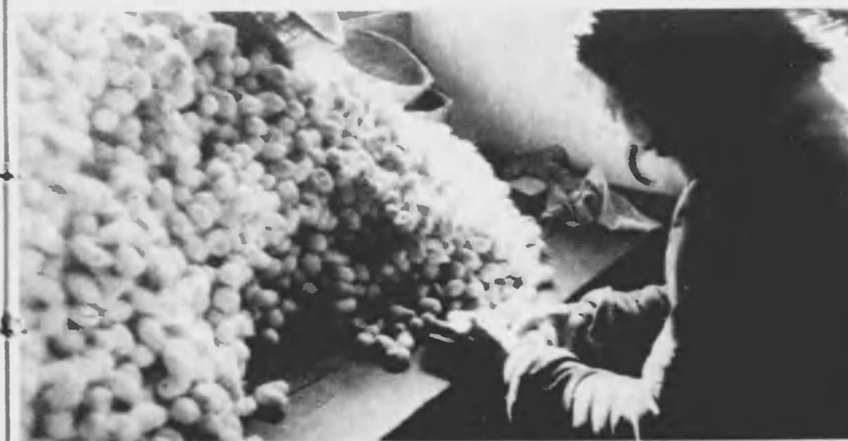
熟練した器用な手先で乾繭の山を振り分けてゆく姑娘。