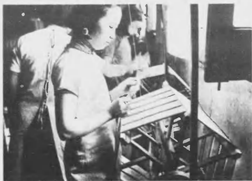
繭座場の姑娘達は鋭い感と素早い眼で僅かな繭も見逃さない。

運轉を開始したものは十八工場六千餘基に達し、製絲生絲は一年二萬噸以上に及ぶ現代となつた。 最近内地からの報告によると、中文の本年の春蠶の作況は近年にない好成績で、この地方の養蠶農民は繭景氣を謳歌してゐる。 今日、世界市場に於ける生絲の需要量は約五〇萬噸でその殆ど全部は日支兩國の供給に於てゐる現状である。ところで、この世界における生絲の需要は人胡や、ナイロン等の新興纖維に置き代はれて逐年減少の傾向にある。そこで、世界市場に對する生絲の二次供給國である日支兩國が相提並べて、東亞の特産競争ともいへるべき生絲の世界需要を維持増進させて、兩國蠶絲業の健全な發達を圖ることが東亞新秩序建設の具體的な一つの現れでなければならぬ。