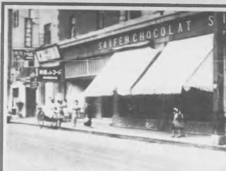
るれ流に頭店は々人行道 けりそこの君なか遠は全 も調戦たつかし流 通に校學てしと々給はあたのりも幼 々舞くる明の背のドーコレ