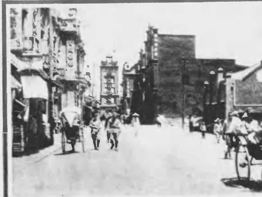
日面く全は州徐點地要重と精を支中と支北 れらけ廣も路道 れか除取は柱電 く行にし足用へ街てつまさおに車 包 戦はどみ休も士勇かわ たし新一を