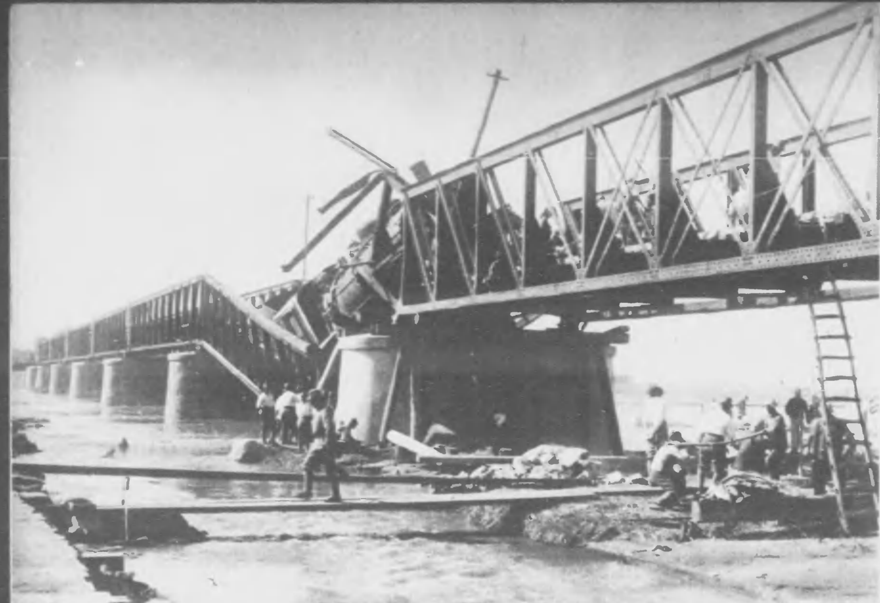
たれら切ら開にんさむ るす進発を橋鐵は車列 てて安を請の設建と★農 破け格もくかは橋鐵はいと橋鐵てし際に却退は敵 橋鐵の方南驛樂新線漢京 らよえび能が譯を影像の時當 るかか工事費後の橋鐵もく早は車皇の迫急 たし埒