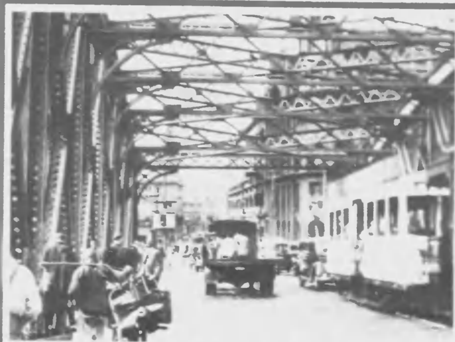
虹てつかも拾 した 編か「積時」通へ西力浦橋は晩朝のチャリブンデーカ るあてらそのわその人黒支だん込れたなへ相英新らか口