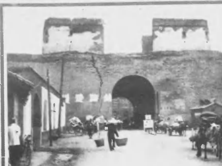
力協支日 たつ戻に市都業商なん盛ぐ夜を昔 は即太たへ迎を人本日の数多 るれは運とへ城府日毎は運物な水費の外城 くしかゆもる邊を路鐵