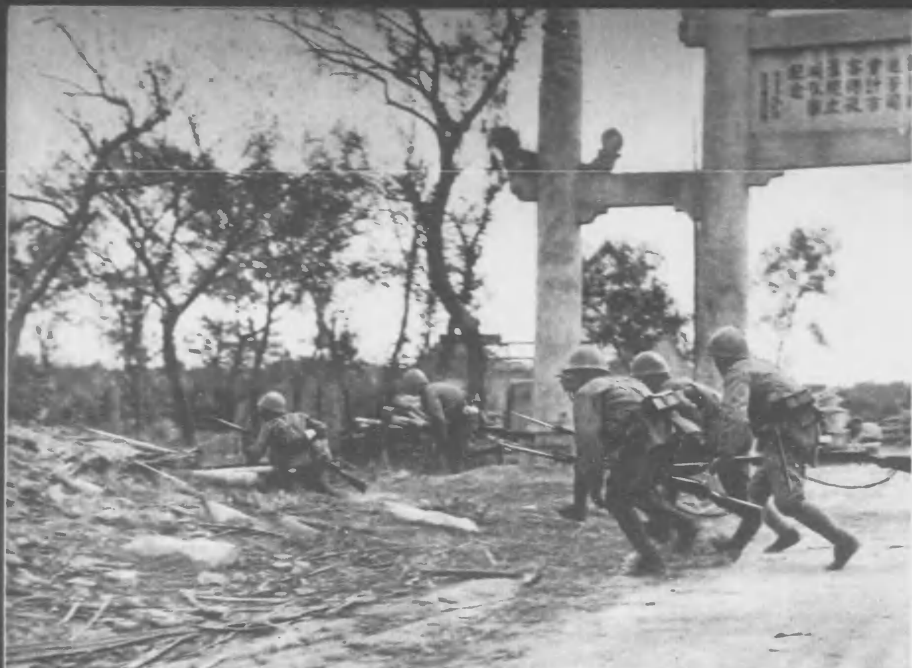
決が士勇か行 る管は岩難に對江の南江 支消か時何も持前たんとみしに地大 日目を用陣の銃機コ エチと彈砲撃迫は隊前語か夜日五廿月十 近附鎮場大 るあてつとも所場み休の士た人農てつたが店茶は 跡たし行敢を入突の死 たし捕古を之に逐刻夕日翌 灣灣てへこを屍 進猛たま進猛て