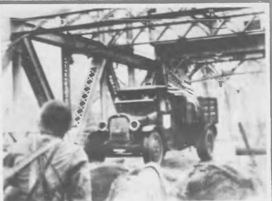
し化と街の亂戦は津天 ているを襲夜の敵 夜日八十二月七年二十和昭 津天 軍皇の中成警備國萬たし持備を安治の内市 退撃をれとに直は軍がた