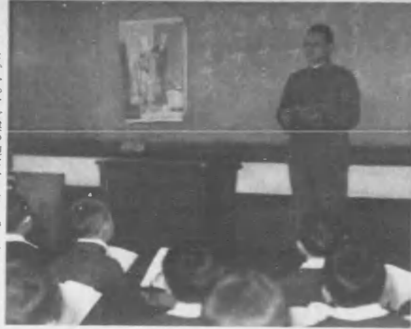
←ケフカラ先生ハコトミンフクマキチキマヌウチノオ兄サンノトオンナジデス