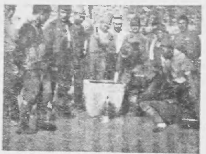
前線作品... 戦後の青い... 戦地ですが、お正月には現...