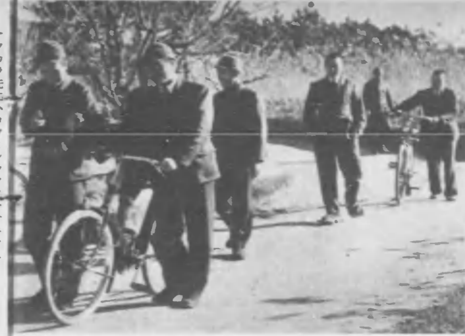
←村長さんをはじめ牧場に通ふ人達の服装もいつの間にか國民服一色になつた