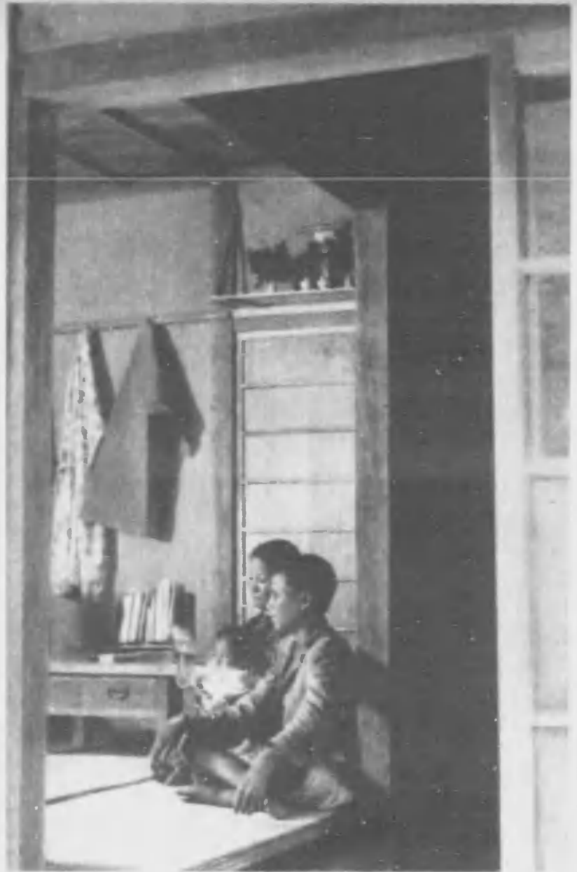
書屋でさへ、日本化して部屋には墨が敷かれ、神棚も設けられた

南方の基地として大きな存在となつた南島の臺灣、こゝでも皇民化運動は最近著しい成果を収めてゐる。臺灣がわが領土に入つてから四十数年、こゝに住んでゐた所謂本島人はわが統治の下に日本人の生活をせよとされた。民族も風俗習慣も違ひ、一帯帯水の大陸を控へてゐることとて、なか／＼思ふやうに同化しない憾みもあつたが、支那事變は皇民化に一大轉機となつた。事變勃發以來、日本が彼等の眼のあたりの支那大陸で威力を示し、着々と世界新秩序の推進力としての地歩を築き上げていつたので、本島人は自分たちの立場を再認識して日本人としての誇りをさへ持つやうになつた。 總督府の皇民化方針によつて、彼等はまづ國語の常用にとめた。津々浦々にまで、國語講習所ができ、公學校(本島人の小學校)では徹底した國語教育を受けてゐる。この結果姓名も日本名にかへる者が多くなつた。本島人の飲食店なども日本名に看板を張り替へてゐる。本島人の家屋の中に日本座敷を設け、彼等が