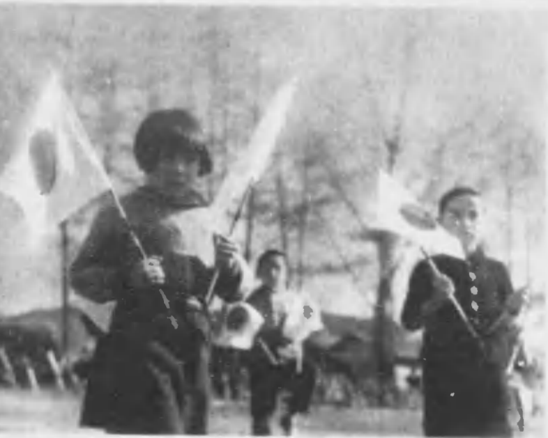
↑ 旗はうれしい日の御旗、足並揃へて進む小國民の足音は高く響く