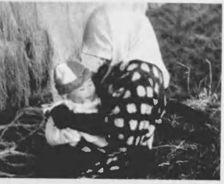
↑ みちたりに、あどけなくほゝむ小兒。この表情のどこに種別の違ひがあらう