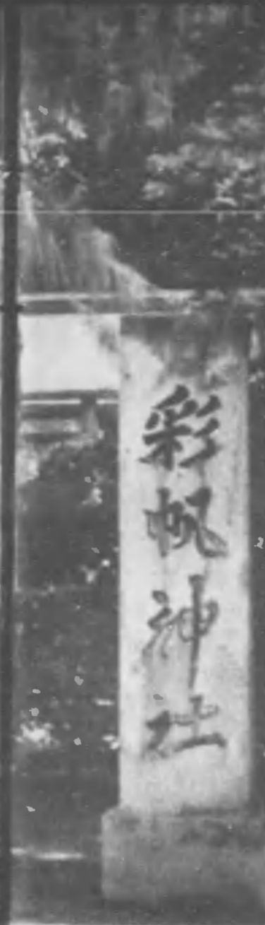
◇ 敬神 彩帆神社の境内に子供達は朝陽を浴びて清掃奉仕する