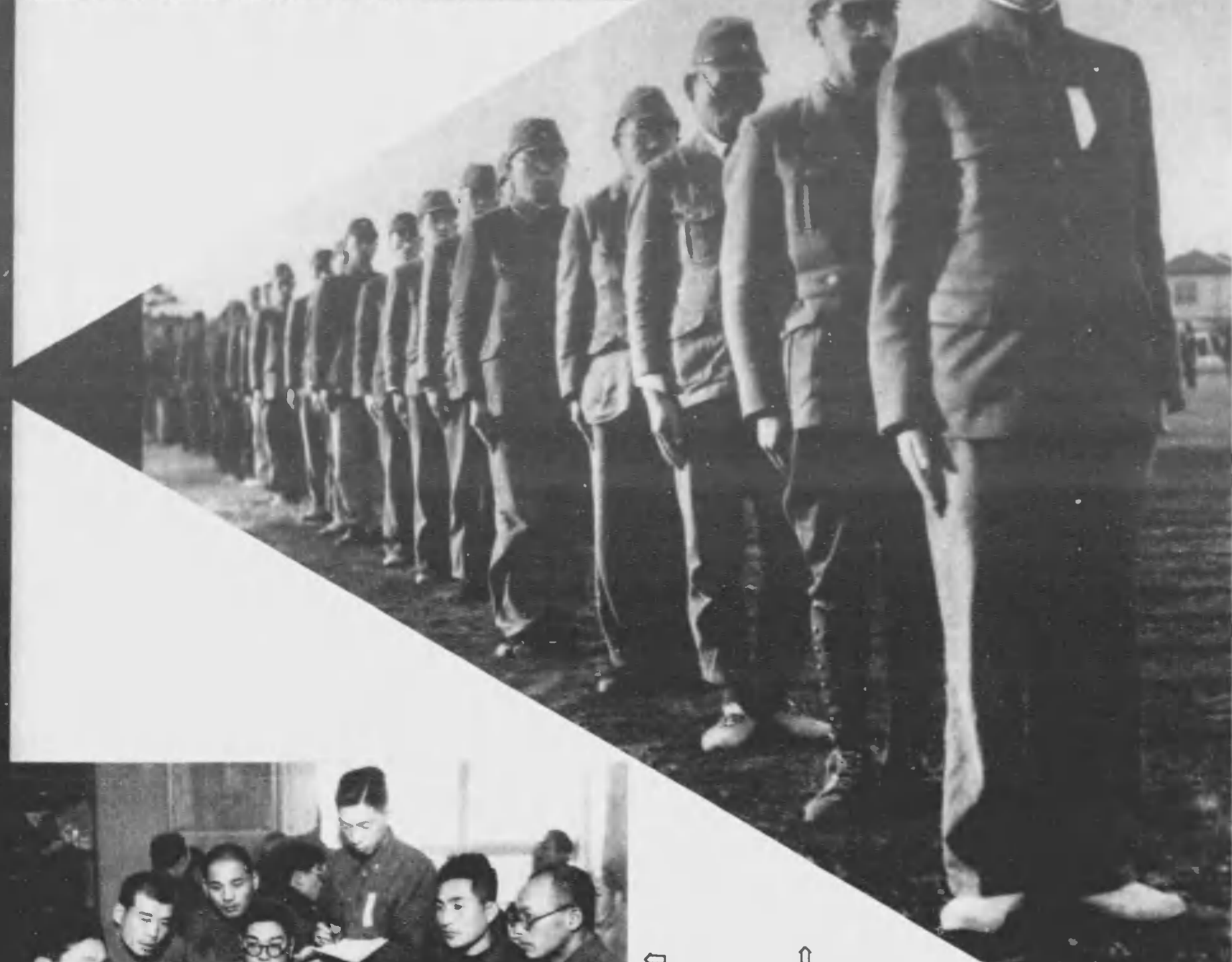
↑ 集團生活には規律が第一、軍隊教練に規律を練る