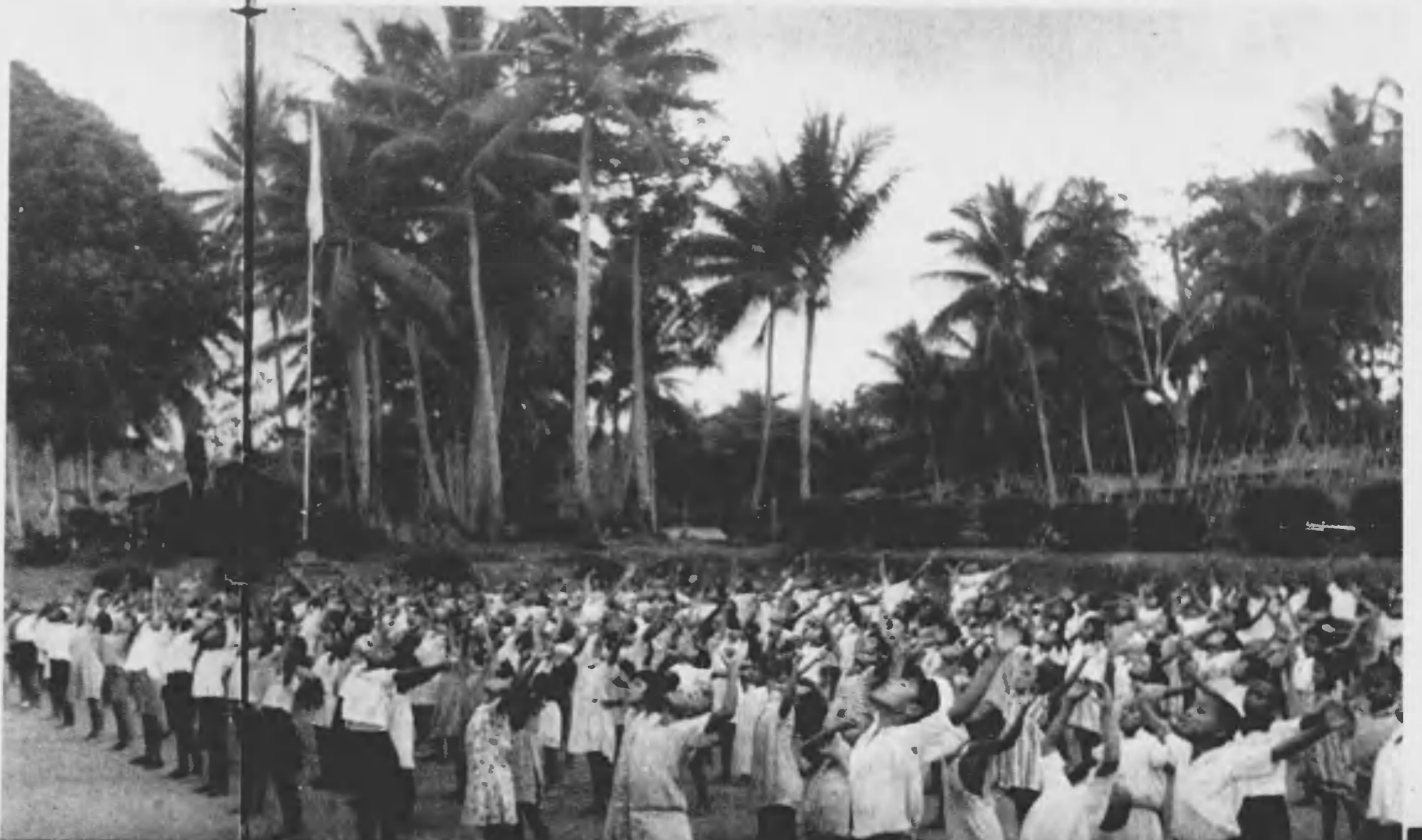
◇ 椰子の木蔭の島の小國民達は今朝も元氣よくラヂオ体操

黒潮しぶく南海の洋上に赤道を中心として散在した大小六百有餘の島嶼。南洋群島が大正十年以後わが帝國の委任統治下に屬してから僅々二十年餘りにすぎないが、わが帝國の南の一翼として新しい發足をして以來島民の教化に、經濟の開發に着々とその効果をあげてきた。今や全島民十三萬は五ひに手を固く握り合ひ、われらも日本人だとの意識に燃え、ひたすら南進日本の最前線基地と懸念に努力してゐる。