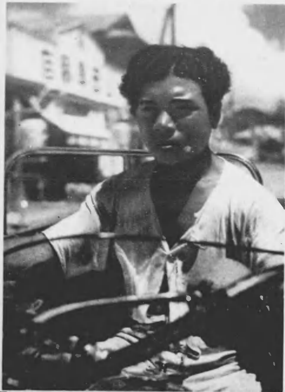
◇ ハンドルを握る手も力強く皇民意識に燃えてオート三輪車を操縦する島の青年

黒潮しぶく南海の洋上に赤道を中心として散在した大小六百有餘の島嶼。南洋群島が大正十年以後わが帝國の委任統治下に屬してから僅々二十年餘りにすぎないが、わが帝國の南の一翼として新しい發足をして以來島民の教化に、經濟の開發に着々とその効果をあげてきた。今や全島民十三萬は五ひに手を固く握り合ひ、われらも日本人だとの意識に燃え、ひたすら南進日本の最前線基地と懸念に努力してゐる。