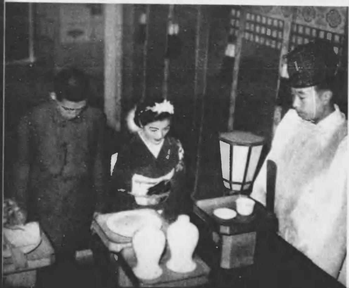
↓神前に二世の契を誓ふこの佳き日、胸間の儀禮章一つに萬感の感激をとどめて

色は地味でも、形は質素でも、時局を乗切る國民の意氣誇らかに胸ふくらます着心地は満點、冠婚葬祭、いづれの場合にもよし、事務服、平常服としてもまたよき持味のある國民服は、大臣から自動車の運転者君に至るまで「これは重寶」と大した好評、まことに春は國民服からといつたところで、 とはいふもの、着られる背廣を脱いでまで新調することは資源愛護に叛きます。いざ新調といふときは是非國民服にしたいものです。無駄な贈答は勿論腹止すべきですが、結婚、就職などのお祝に、心からの贈物として國民服一着を進呈するなどは本人の門出にふさはしいものではありませんか まことに春は國民服から――