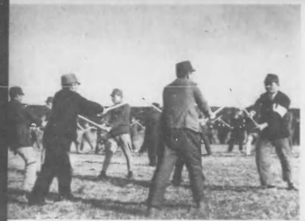
← 身心の鍛錬には武道、寒氣何物、一年一度の一時を剣道の型に打込む