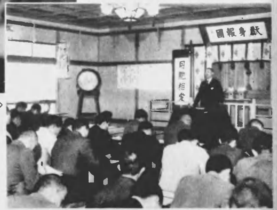
清淨な朝は理論的な講義を受ける