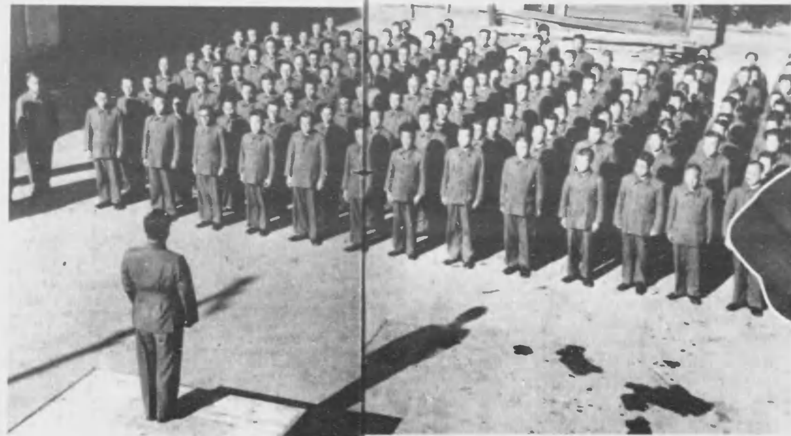
⇒背廣の感傷は昨日のこと「番號」とやればもういつはしの兵隊さん