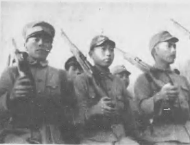
銃をになつてキツト前方を視つめたアイヌ青年の眉宇にも皇國民の意氣が溢れる