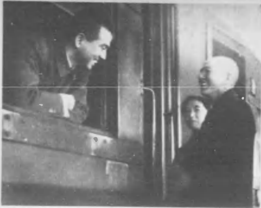
←「...といふわけで僕の腕は手まはり品とねまきだけ。どこもこれ一宿といふ身軽さです」