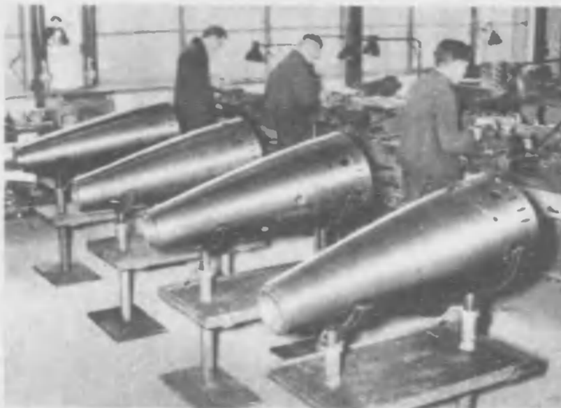
わづか百トンそこ／＼の小艇ながら、その快速と魚雷の威力で何萬トンの敵艦をも恐れしめる獨逸軍の魚雷艇の工廠