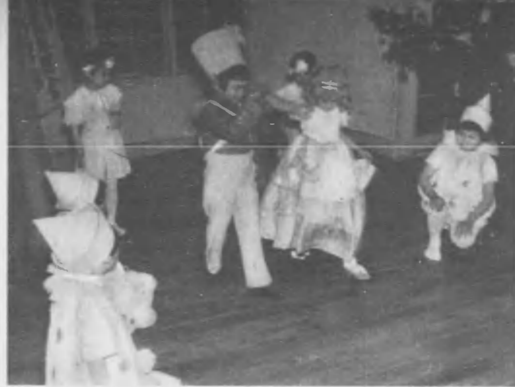
「子供の家學園」は團長の家でもなければ保母の家でもない、子供の家、子供が七人公の家です