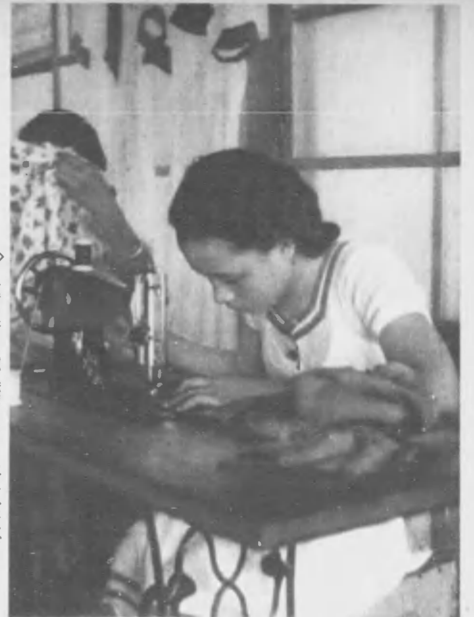
◇ 針音も快よく島の娘達はミシンもあざやかによむ