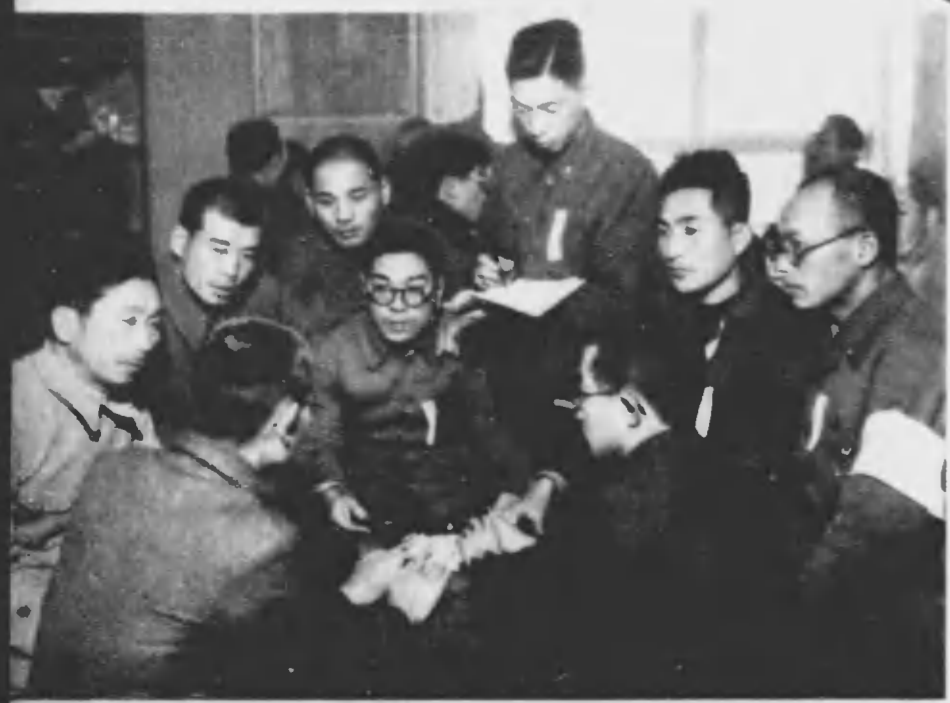
← 合宿生活には各グループが作られ、各自の生活態度に、理論闘争にグループ常會は真剣だ