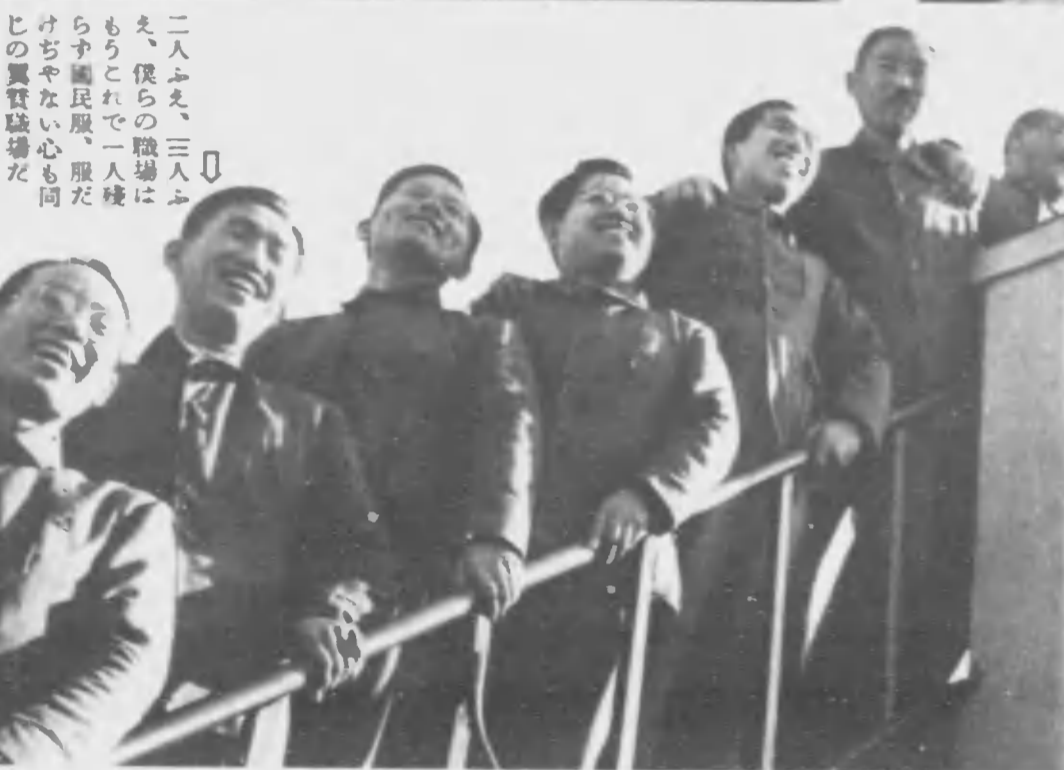
↓二人ふえ、三人ふえ、僕らの職場はもうこれで一人種らず國民服、服だけぢやない心も同じの眞實感場だ