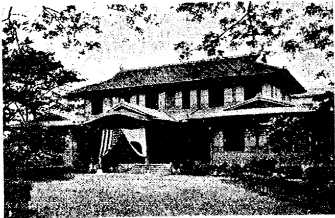
マニラ日本人俱樂部

本群島の全面積は二十九萬六千二百九十四平方軒で實に我臺灣の八倍餘もあります。其の中最大なのはルソン島で、ミ