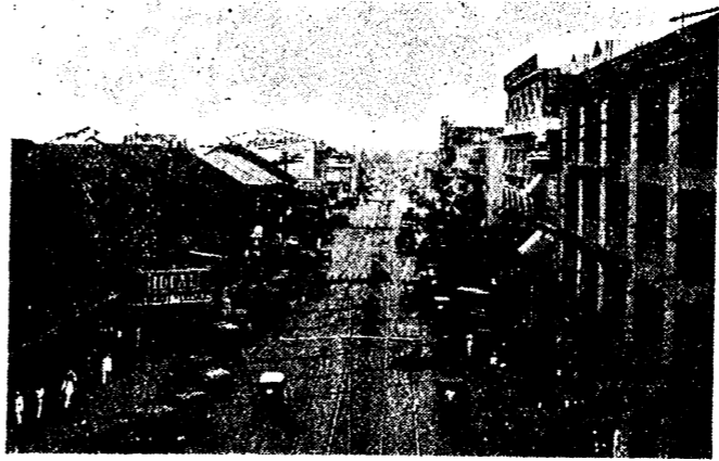
マニラ邦人活躍地帯

尙本群島の住民は大別して基督教徒族と非基督教徒族に大別され、普通比律賓人と呼ばれてゐますのは前者で全人口の八分の七を占め、此度の比島