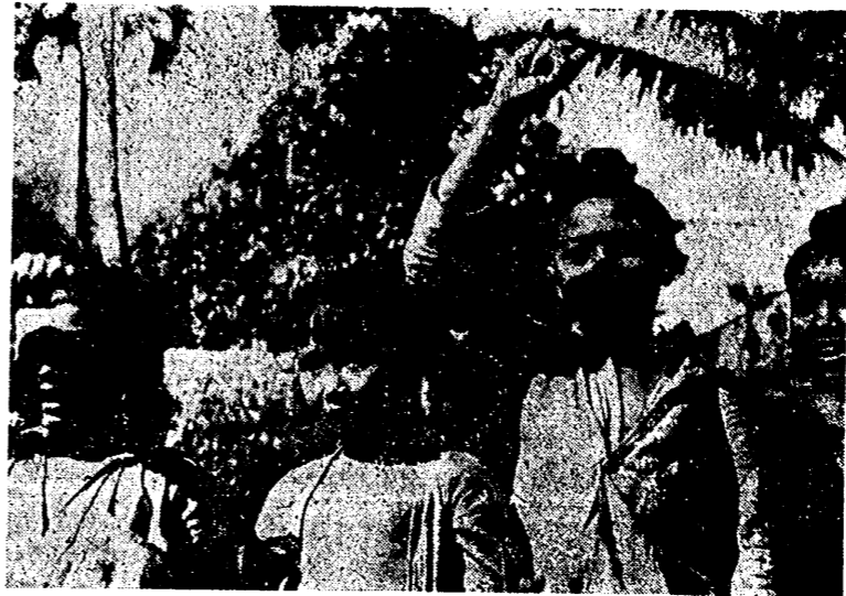
皇軍を歓迎するビルマの子供たち