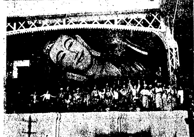
(てに前佛塔大のーダベ下・前邸官督總市ンダラ・上) 聖制をマルビ軍皇