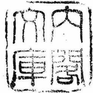
表 計 統