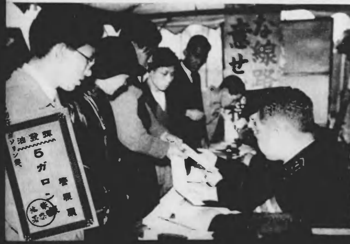
たとへ一滴のガソリンでも大切にせねば