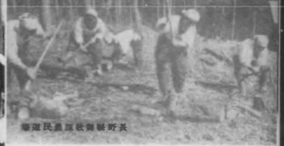
長野縣教育委員長 長野縣民衆教育委員

亜細亞に拓く人生の雄力者、 拓日本男子の同伴者として、 全日本の女性に、新しい使命が 興へられた。 日本女性の持つ、愛で育む 美しい心機は、そのまま、土を 拓く力となる。 「大陸日本一の雄健は、男にだ け興へられた仕事ではない。大 きなふところを備えた大陸へ、 女子もまた大志して進出さ なければならぬ。」 長野縣民衆教育委員の長野縣民衆 教育委員の長野縣民衆教育委員 は、移民花嫁學校を開設さ れ、新しい使命の花嫁として、新 亜細亞に拓く青春の夢は大きい。