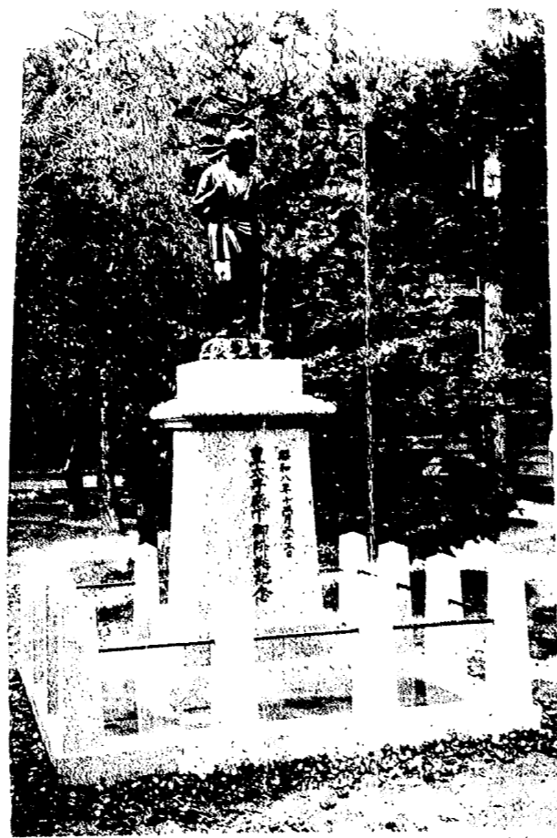
後明生果位塔在正前中村本宮 21