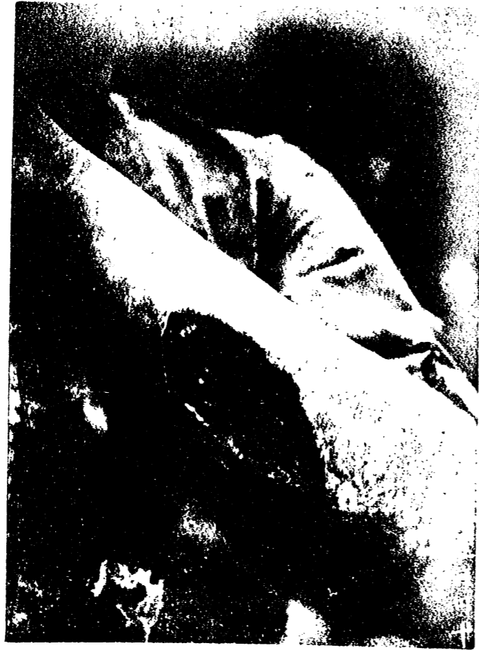
Second private Kondo, 18 th , Infantry.